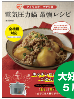
アイリスオーヤマ公認 電気圧力鍋 最強レシピ